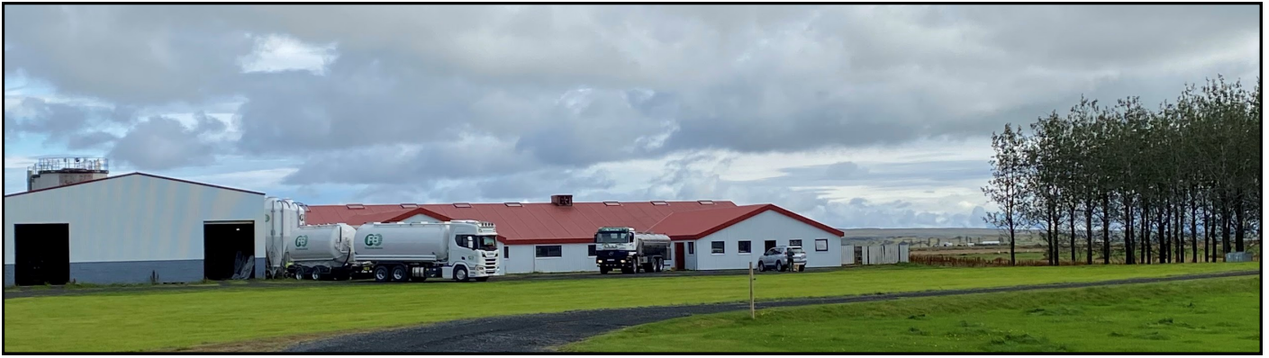
Stóra Ármót, allt að gerast, fódurbíll, mjólkurbíll og dýralæknir.