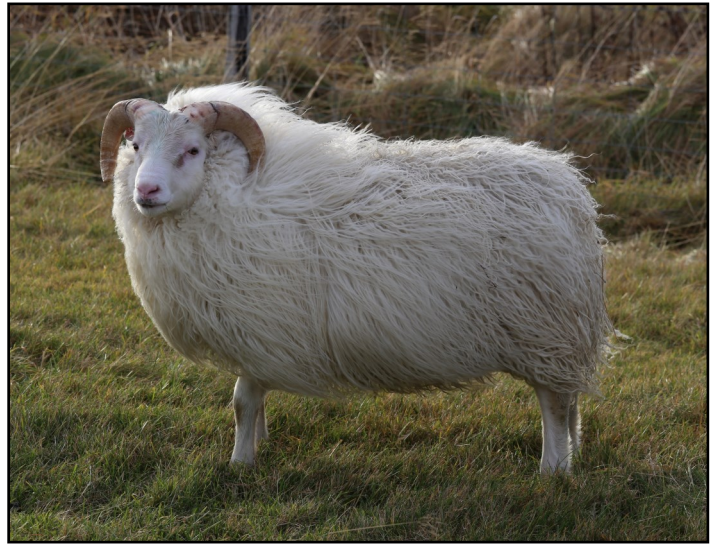
Fannar frá Svínafelli 23-925.

Finnska hugbúnaðarfyritækið Mtech er að útbúa fyrir okkur smáforrit til að nota í sæðingunum. Bændur panta sæðingu í gegnum forritið og skráningu lýkur um leið og sæðingu er lokið. Jafnframt heldur forritið utan um allan akstur og því mun liggja fyrir í lok dags akstur á hverja sæðingu á hverju svæði fyrir sig. Þörunaráætlun verður tengd við forritið og kæmi sjálfkrafa inn í pöntunina. Vonir standa til að forrit þetta verði tilbúið á árinu. Forritið