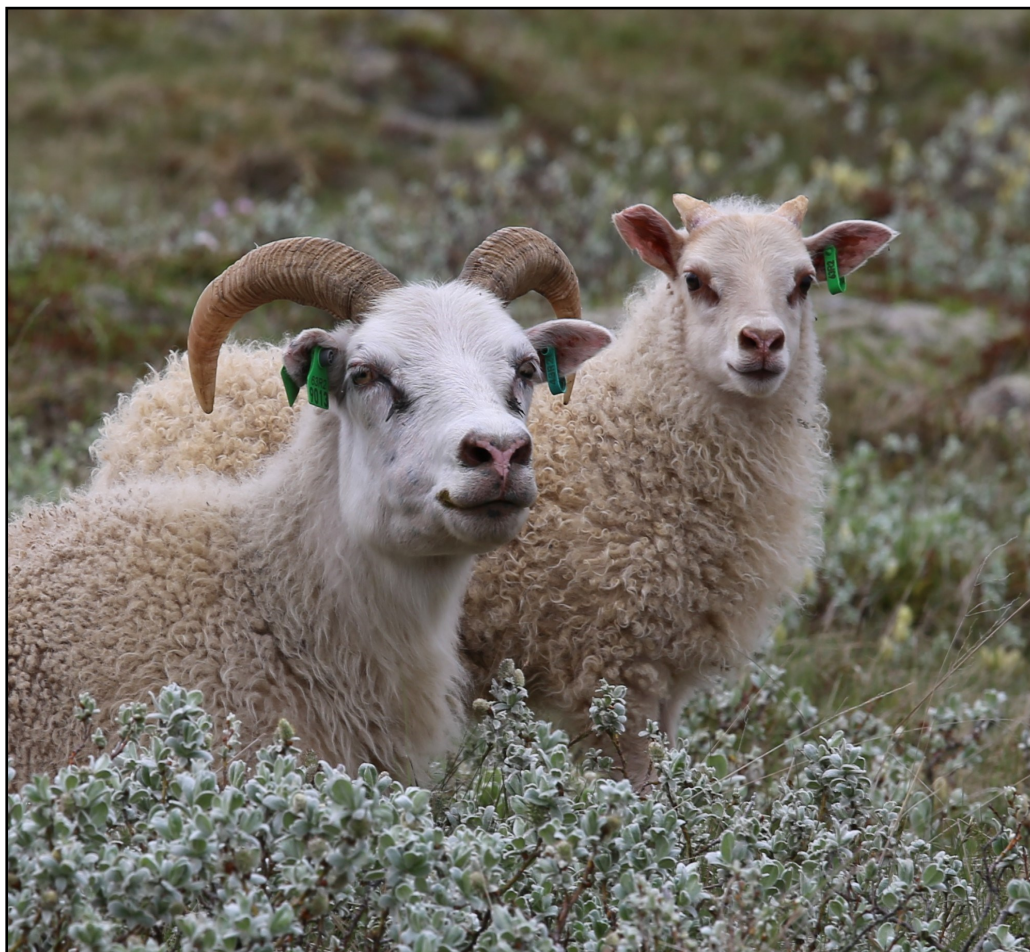
Mynd: Íslenska sauðkindin