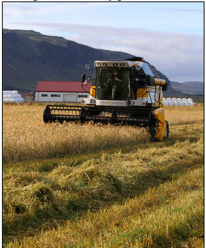
Korn preskt á Stóra Ármóti.

Gengið var frá stofnun fjögurra lóða við Ármóts-