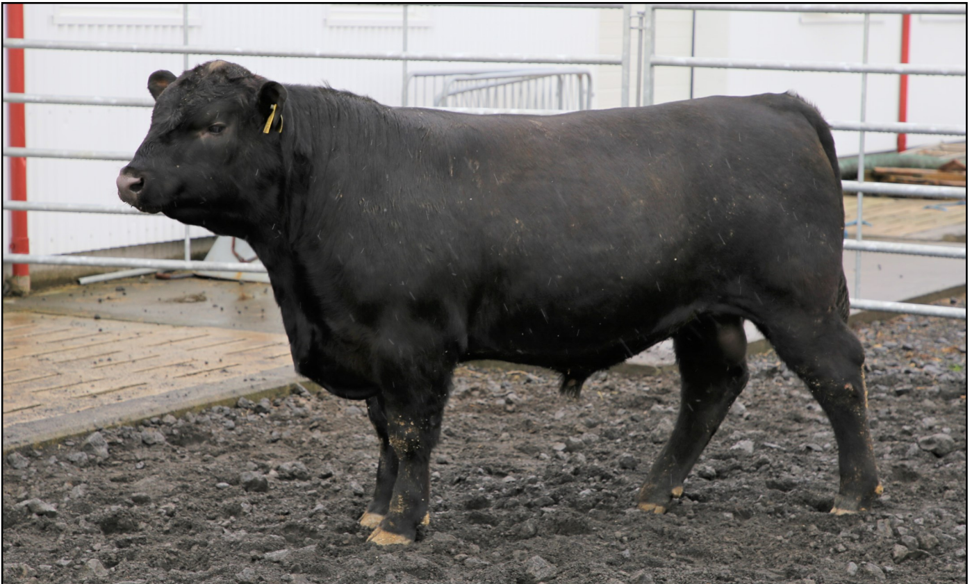
Laki 0056 sem er undan Laurens av Krogdal.

Sæðistaka var í júní og júlí og gekk vel. Öll nautin gáfu sæði, Þeir Laki og Lilli gáfu þrýðis sæði, samtals um 1800 skammta en Lækur og Lárus voru með lakari sæðisgæði og náðust bara um 500 skammtar úr þeim. Holdanautabændur geta fengið erfðæfnið með því að kaupa lífdýr en einnig með því að nýta sér sæðingar sem því miður of fáir