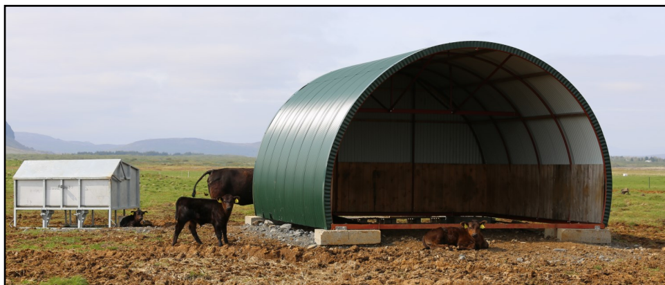
Tafla: Gripir í eigu Nautís

Bogahýsi sem reist var haustið 2022 og nýtist sem gott skjól. Til hliðar er kjarnfóður- gjafabás fyrir kálfa, sem kýr komast ekki í.