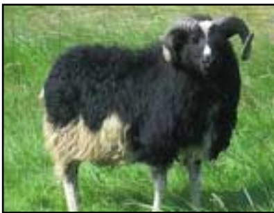
Forystuhrúturinn Tígull frá Smáhömrum.

Keyptir verða þrjú hrútar frá því mikla afurðabúi Bergstöðum á Vatnsnesi, V.-Húnavatnssýslu: Á myndinni eru þeir allir saman. Frá vinstri kemur fyrstur Lási (Lóðason). Lási er hvítur, hyrndur. Næstur er Busi (sonarsonur Lóða). Busi er einnig hvítur hyrndur. Busi er bjartastur og krapphyrndastur af Bergstaðahrútunum. Þriðji er Lundi (Lekason). Lundi er sömuleiðis hvítur, hyrndur með áberandi geira í horni og með lengstu hornin af þeim Bergstaðahrútum. Lundi er gulur í hnakka og dindli.