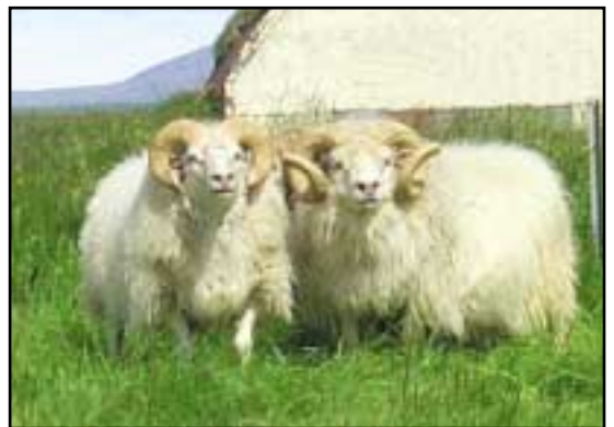
Lubbi (til hægri), hér ásamt Busa frá Bergstöðum.