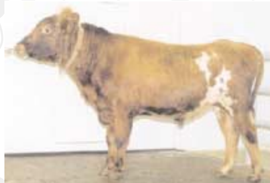
Pollur 99008 frá Pverlæk, besta naut 1999 árgangsins.