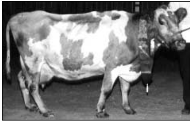
Fífa 229 í Hróarsholti.