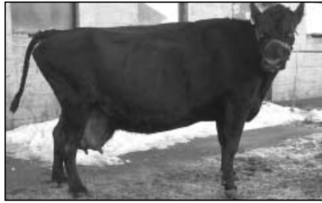
Tinna 371 í Birtingaholti 1.