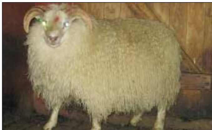
109 frá Ytri-Skógum, f. Hlekkur 02-201.