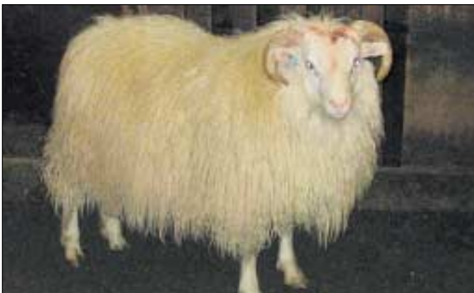
105A frá Fornustekkingum f. Jökull 04-124.

Fulldæmdir voru hátt í 2.800 lambhrútar, 677 veturgamlir