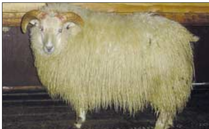
5199 frá Heiðarbæ, f. Kuldi 03-924.