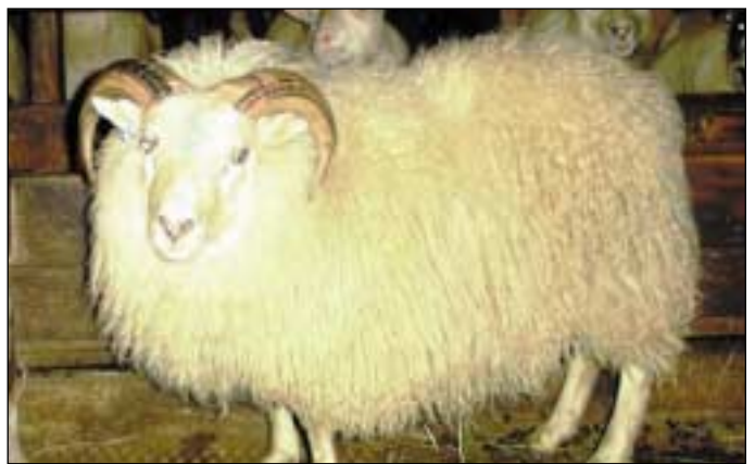
53 frá Syðra-Velli, f. Áll 00-868.

Alls voru dæmdir 677 veturgamlir hrútar í sýslunum fjórum, þ.a. voru 134 í Austur-Skaftafellssýslu. Í Árnes-, Rangárvalla- og Vestur-Skaftafellssýslu voru dæmdir 543, 52 fleiri en 2004. Mestur fjöldi dæmdra hrúta var í Skaftártungu (55), Kirkjubæjarhreppi (53) og Nesjahreppi (42). Meginpartur hrútanna fór í l verðlaun eða 99%.