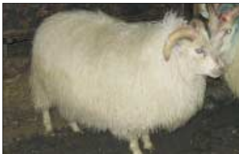
244A frá Fornustekkingum, f. Frosti 02-913.

Allar töflur sem dreift var á fundunum er hægt að nálgast á heimasíðu Búnaðarsambandsins.