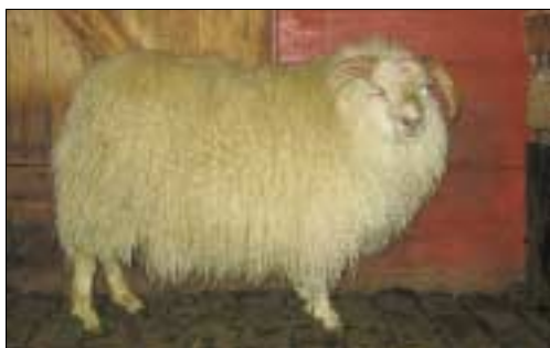
110 frá Ytri-Skógum, f. Hlekkur 02-201.