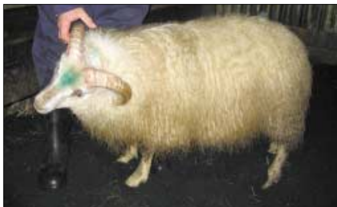
2892 frá Gröf, f. Jarl 04-140.