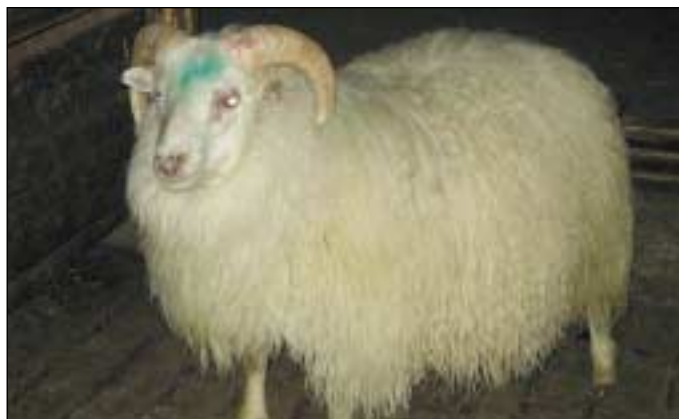
1593 frá Búlandi, f. Týr 02-929.