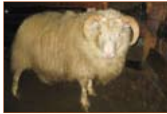
751A, Fornustekkingum, f. Forseti 05-135.