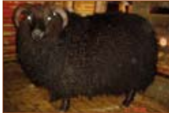
113, Hvammi, f. Gráni 03-957.