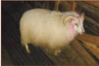
1169, Úthlið, f. Dregill 03-947.