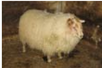
536, Skarðshlið, f. Snigill 05-281.