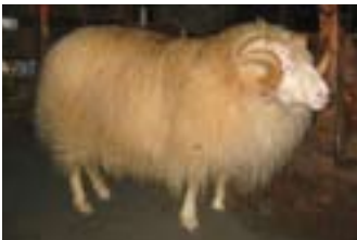
Glæsir 06-186, Fornustekkingum, f. Bjartur 02-353.