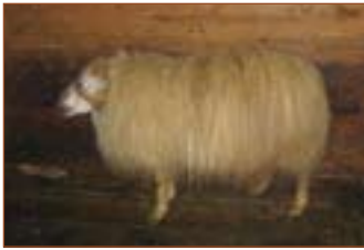
Feldur 06-042, Tóftum, f. Lómur 02-923.