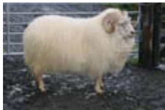
Alki 06-297, Ytri-Skógum, f. Hlekkur 02-201.