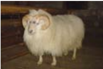
Hlemmur 06-099, Fagurhlið, f. Tvinni 03-083.