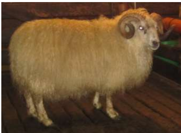
Angi 09-571 frá Hlíð, f. Raftur 05-966