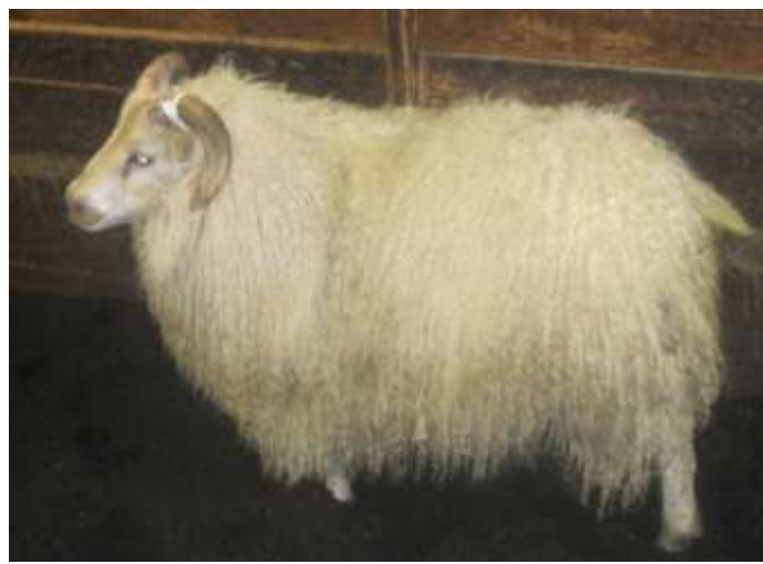
Nr. 097 á Fitjamýri, f. Borði 08-838