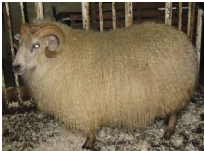
Klettur 09-027 frá Stóru-Reykjum, f. Bifur 06-994.

Í haust voru dæmdir 663 veturgamlir hrútar sem er 103 hrútum fleira en haustið 2010 og hafa þeir ekki verið fleiri síðan 2006. Vænleiki var aðeins minni en í fyrra en hrútarnir voru að meðaltali 81,4 kg. Þyngstu hrútarnir voru í Austur-Landeyjum 88,8 kg að meðaltali. Meirihluti hrútanna eða 98% fékk I verðlaun A. Flestir hrútar voru dæmdir í Holta- og Landsveit 55 og þar á eftir kom Suðursveitin með 40 hrúta. Veturgömlu hrútarnir dæmdust aðeins hærra þetta haustið, bæði í lærastigum og heildarstigum, þó svo að ómvöðvi væri aðeins þynnri og vænleiki minni. Af þessum 663 hrútum voru 329 (50%) undan sæðingahrútum, 284 undan þeim hyrndu og 45 undan þeim kollóttu. Raftur átti flesta syni þetta haustið eða 63. Á eftir honum komu Lundi með 33, Krókur með 31 og At með 30 syni. Raftssynirnir komu best út að öllu leyti. Garpur átti flesta syni af kollóttu hrútunum eða 15. Næstir á eftir honum komu Undri með