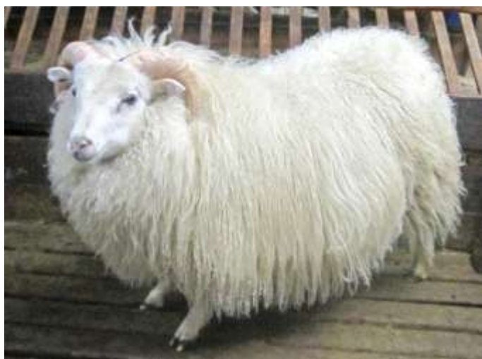
Nr. 1331 í Vogsósum, f. Kveikur 05-965.

BLUP verðlaunaveitingarnar eru veittar á hverju hausti, þar sem reiknað er út frá upplýsingum úr skýrsluhaldinu árið áður. Á fundi Sauðfjárræktarnefndar BSSL í ágúst s.l. var samþykkt að nota alla þætti kynbótamatsins til að vinna heildareinkunn fyrir hrútinn. Heildareinkunnin er samsett af einkunn fyrir fitu, gerð, mjólkurlagni og frjósemi ((fita+gerð+mjólkurl.+frjós.)/4=heildareinkunn). Með þessum hætti erum við að verðlauna hrúta sem eru bæði góðir í kjötmatinu og gefa líka góðar dætur. Heildareinkunnin var aðeins misjöfn á milli sýslna og var hún áberandi hæst í Rangárvallasýslu þar sem allir hrútarnir þar voru með mjög góðar einkunnir fyrir dætur. Af þeim 20 hrútum sem voru verðlaunaðir í sýslunum fjórum á Raftur 7 syni, Kveikur 6 og aðrir Hesthrútar 5 syni. Hesthrútarnir eru ennþá sterkir í þessum flokki og verða eflaust næstu árin. Efstur í Árnessýslu eins og