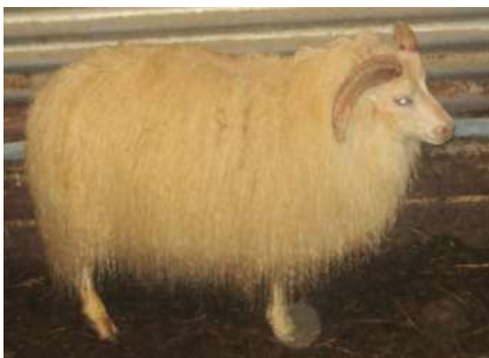
Nr. 081 á Hamri, f. Stubbur 05-007.