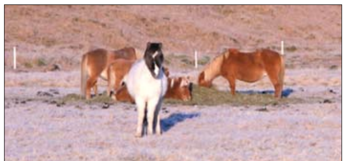
Útgangshross í góðu atlæti.