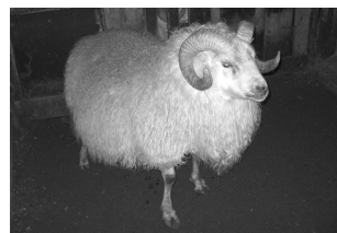
Ýmir 05-145 frá Fornustekku. F: Fjári 03-213.