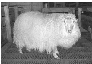
02-112 frá Prestbakka. F: 02-102..