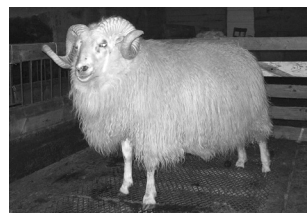
Álfur 05-286 frá Drangshlíðardal. F: Týr 02-929.